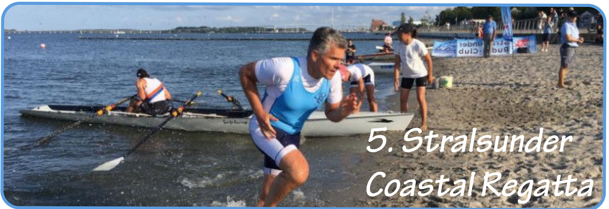
5. Stralsunder Coastal Regatta